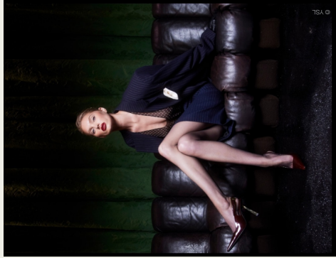
↗ Elsa Hosk