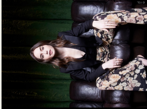
↗ Lily Collins