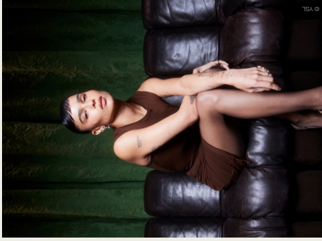
↗ Zoë Kravitz