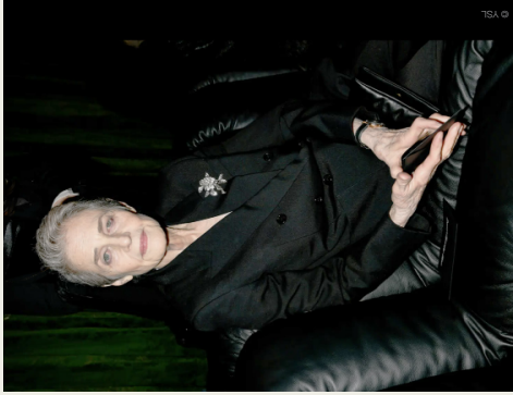
↗ Charlotte Rampling