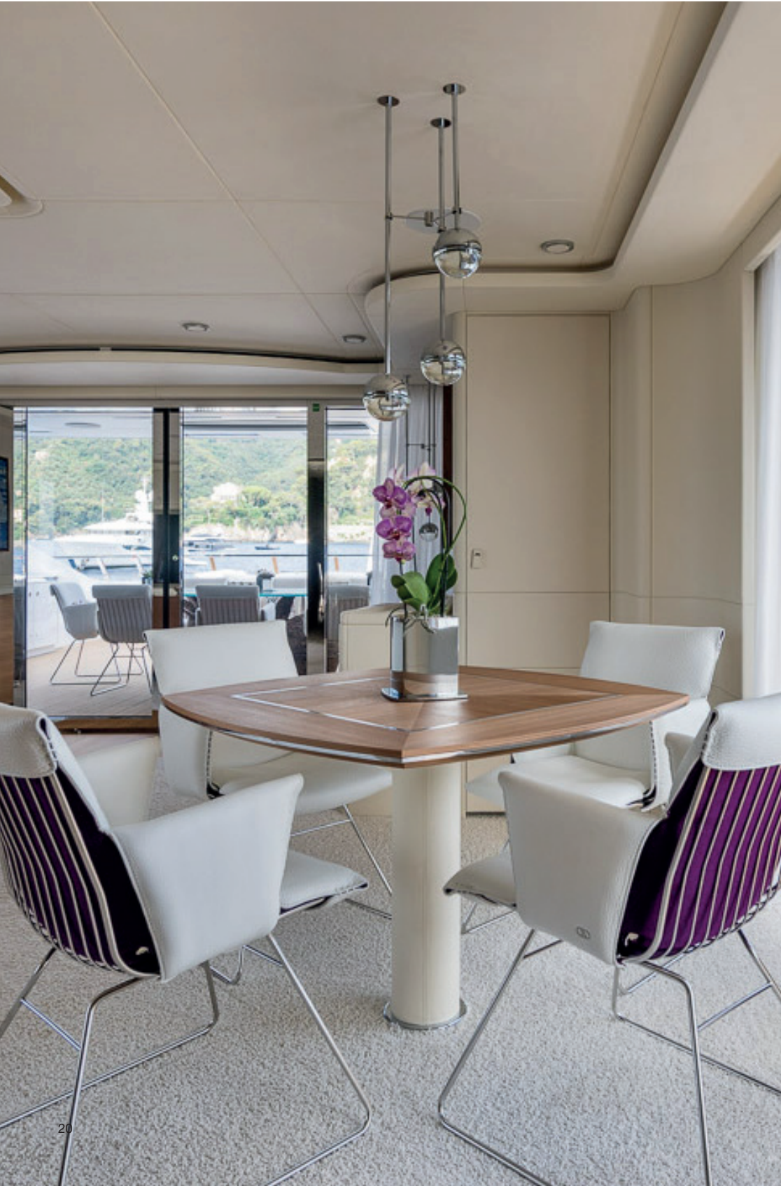
In lichtdurchflutetem Ambiente: Auf den DS-515-Stühlen sind Gespräche so fließend wie das Wasser An atmosphere awash with light: conversations flow like water on the DS-515 chairs