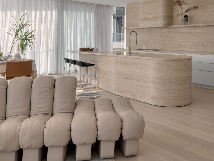
Ein Ensemble für die kleinen Rituale des Alltags: Sofa DS-600 und Barstühle DS-717; Freischwinger RH-305 (Bild rechts) The perfect trio for your little everyday rituals: the DS-600 sofa, the DS-717 barstool, and the RH-305 cantilever chair (image on the right)

Am Morgen weckt ein sanfter Wellenschlag, der Abend beginnt mit einem Strandspaziergang in den Sonnenuntergang und dazwischen macht das Dasein wahre Freude: Auch dank fünf ikonischer Skulpturen von de Sede ist in diesem spektakulären australischen Beach House das Leben ein einziger Traum.