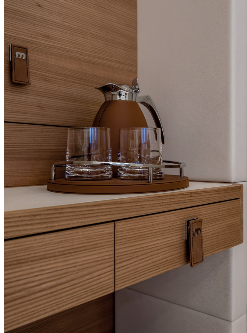
Liebe zum Detail: Handgefertigte Ledergriffe prägen die 250 Schubladen auf der Yacht A love of detail: handcrafted leather handles adorn the 250 drawers on the yacht