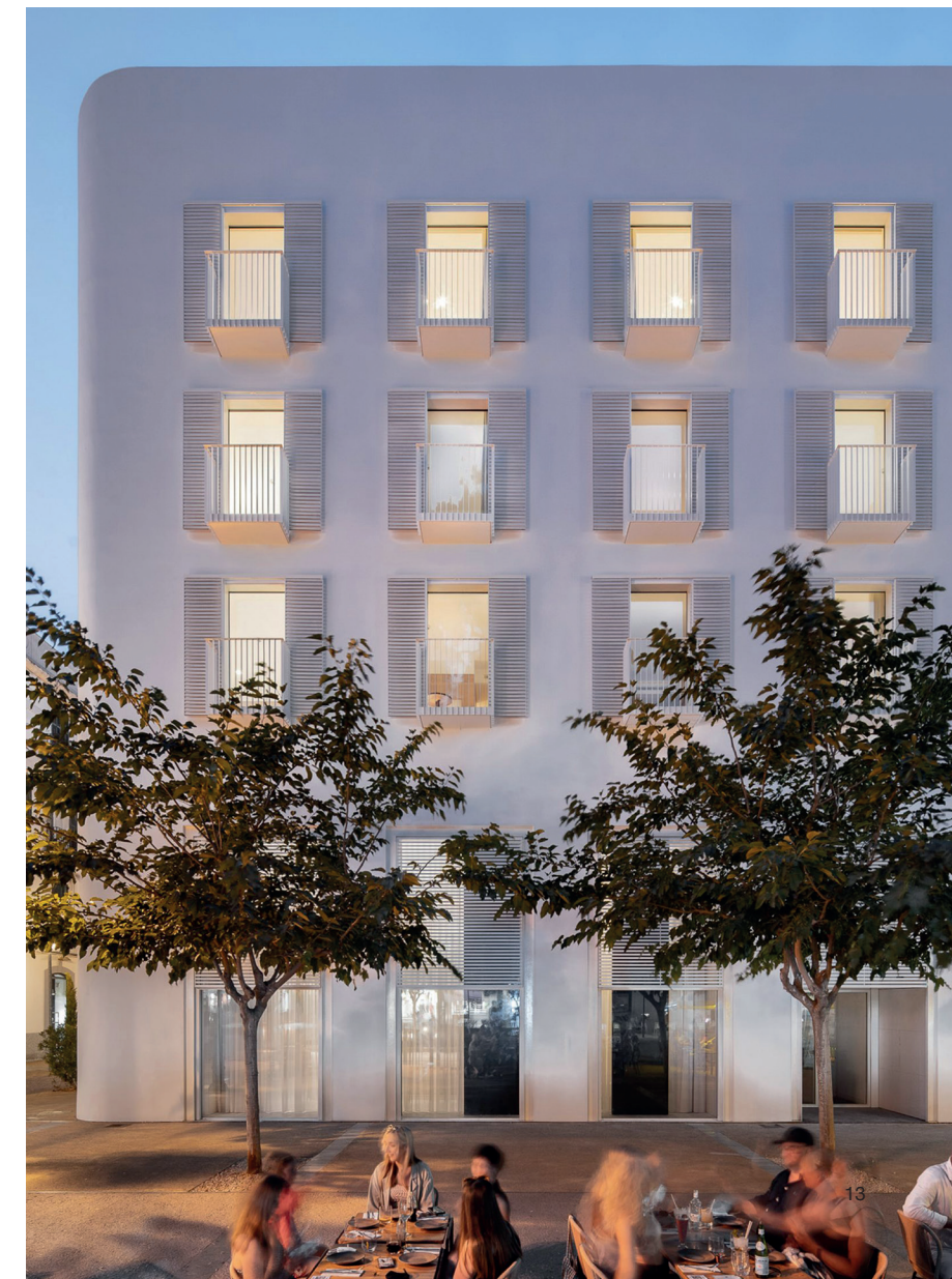
Eine Oase der Ruhe inmitten der Partymeile: «The Standard» auf Ibiza An oasis of calm in the midst of the party strip: "The Standard" in Ibiza

Ein Mix aus der für Ibiza typischen Ästhetik und kalifornischer Coolness. The typical look of Ibiza combined with Californian coolness.